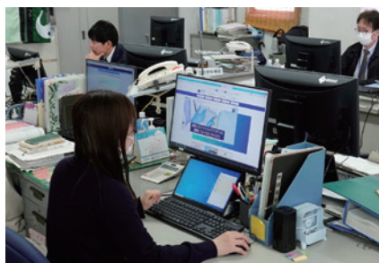
山梨県 都留市役所 様