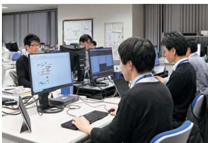
滋賀県 大津市役所 様