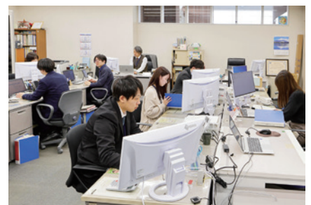
宮城県 利府町役場 様

289台のモニターを付属品レス・集合梱包で導入 国内自社一貫生産を生かした柔軟な納品形態をご提案