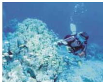
従来画面 (コントラスト比300:1)

DVDやWebストリーミング表示など、動画画像再生のために250cd/m 2 の高輝度を実現。高コントラスト比400:1で、メリハリある画像を提供。