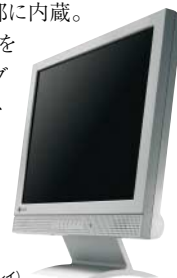
L465 (カラー:セレーングレイ)

スピーカーユニットをフロント部に内蔵。コンパクト化、省スペース化を実現する狭額ベゼル、ACアダプタ不要の小型電源ユニットを採用。リサイクル性とデザイン性を両立させたアルミ製スタンドを装備し、2つのカラー設定を用意しました。