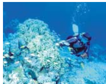
L465画面 (コントラスト比400:1)