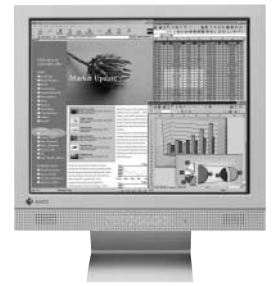
L465 (カラー:セレーンレイ)