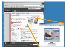
■ブラウザ上の一部をキャプチャし、拡大

DesktopViewerは、デジタルカメラで撮った写真やイラスト等の静止画 (JPEG、BMP、TIFF) や動画 (AVI、MPEG等) を、明るくきれいにディスプレイ上で表示したり、画像特性にあったモードで見ることができる機能です。また、スライドショーとしての鑑賞や