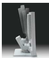
■高さ調節機能付きスタンド

ベゼル幅10mmのコンパクトデザインを採用するとともに、機能的な高さ調節機能付きスタンドを標準装備。上下50mmの昇降範囲で無段階調整が可能です。さらに、フロント下部を階段形状にし、