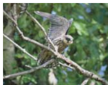
従来画面 (コントラスト比300:1)

DVDやWebストリーミング表示など、動画再生のために250cd/m 2 の高輝度を実現。コントラスト比350:1でメリハリのある画像を提供。