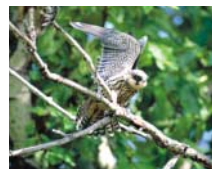
L355画面 (コントラスト比350:1)