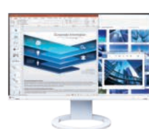
FlexScan EV2480-Z 23.8型 フルHDモニター