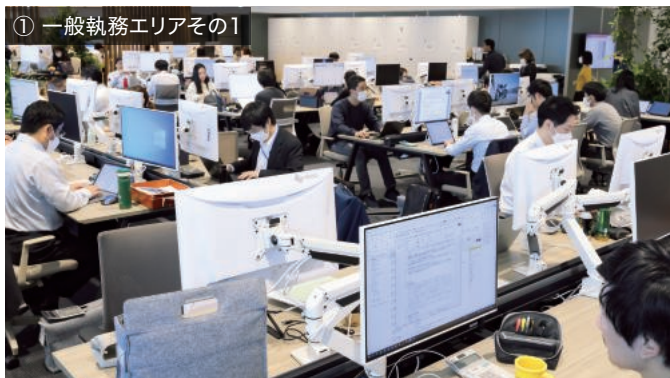
① 一般執務エリアその1

ABW型のオフィスは、社員が主体性を持って目的に沿った場所を選ぶことを目指して職場環境を構築しました。モニターを導入するエリアは計4か所あり、目的に合わせてモニターを適切に選定する必要がありました。EIZOはUSB Type-C®対応モニターのラインナップを豊富に揃えていることも選定の大きな決め手となりました。