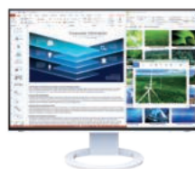
FlexScan EV2485 24.1型 WUXGAモニター