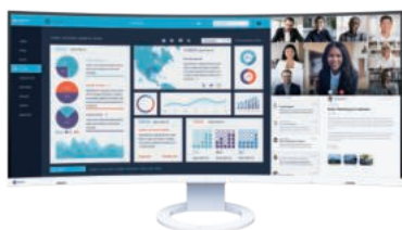
FlexScan EV3895 37.5型 ウルトラワイド曲面モニター