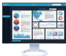
FlexScan EV2495 24.1型 WUXGAモニター