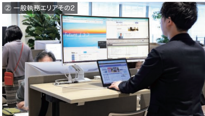
② 一般執務エリアその2