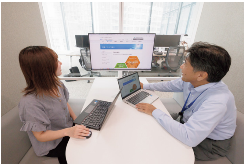
EV3240Xはミーティングスペースにも導入 31.5型の大画面で、打ち合わせ時の資料共有も快適