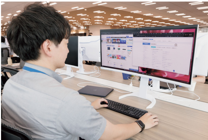
34.1型の大画面かつ、湾曲して隅々まで見やすいEV3450XC

社員間のコミュニケーション強化を図るために、新オフィスではグループアドレス制を採用していますが、EV3450XCが標準モニターですので、どの席で業務を行っていても高い作業効率を維持できます。また、モニターに資料を表示して相談をする場面でも資料を大きく表示できてとても便利で、円滑なコミュニケーションに大きく貢献していると感じます。