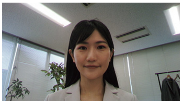
一般的なノートPC内蔵カメラ

EV3450XCは、モニターに搭載されたWebカメラも活用しています。ノートPCと接続するだけで、Webカメラがモニターの上部ベゼルに内蔵されており、正面からの映像を自然に映し出せるので、快適なWeb会議環境が整いました。特別な操作や新たにカメラを用意する必要もないですし、目立たないようにカメラが内蔵されていてスタイリッシュです。