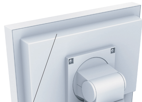
通気孔のない設計