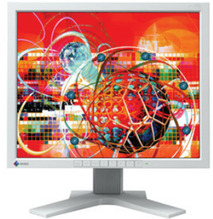
ColorEdge CG18(カラー:セレーングレイ)

46cm(18.1)型キャリブレーション対応カラー液晶モニター(可視域対角45.9cm) オープン価格 1