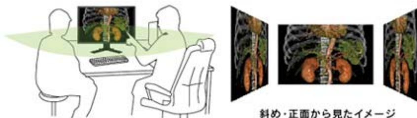
斜め・正面から見たイメージ