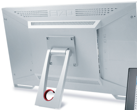
カラー：セレーングレー