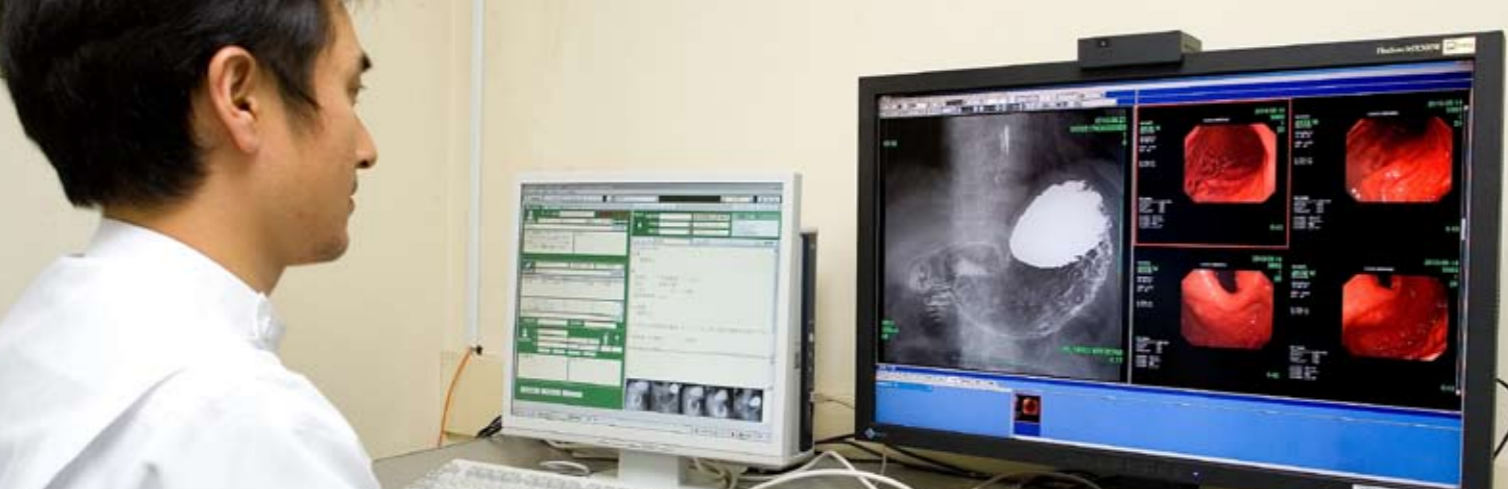
透視室でも壁一面にあったシャーカステンをワイドモニター1面に置き換え