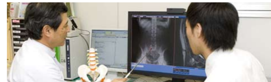
半切サイズフィルム2枚分の情報が同時に表示できるワイドモニター

年に1回の実施がJESRAで推奨されている不変性試験を、PACS導入から1年目の今年9月、放射線科のメンバーで実施