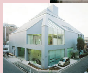
導入製品 ColorEdge CG220 FlexScan L797