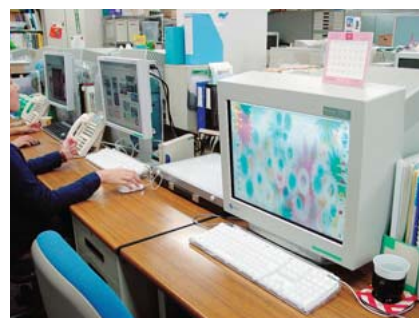
同じ机に置かれたCRT(手前)とLCD(奥)。LCDの背面にはPCが設置されているにも関わらずまだこれだけのスペース差がある。

に増やし、最終的には全面的にCTP印刷にしていきたいと考えている。「そのためにもますます色管理の精度、安定性が大切になってくると考えています。」（山村氏）