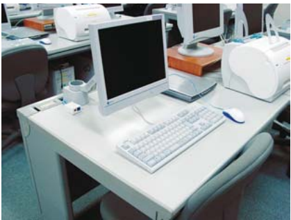
ノートパソコンを使う際には、モニター画面を奥に移動させ、キーボードを画面下部のスペースに収納していただくことで、モニター前面のスペースを広く使える。

さらにアームでしっかりと机に取付けられているので、耐震面や盗難防止の面でも、アームは有効であるという。「その他、導入したことによるメリットはたくさんありますが、デメリットは思いつきませんね」と加藤氏は高く評価する。