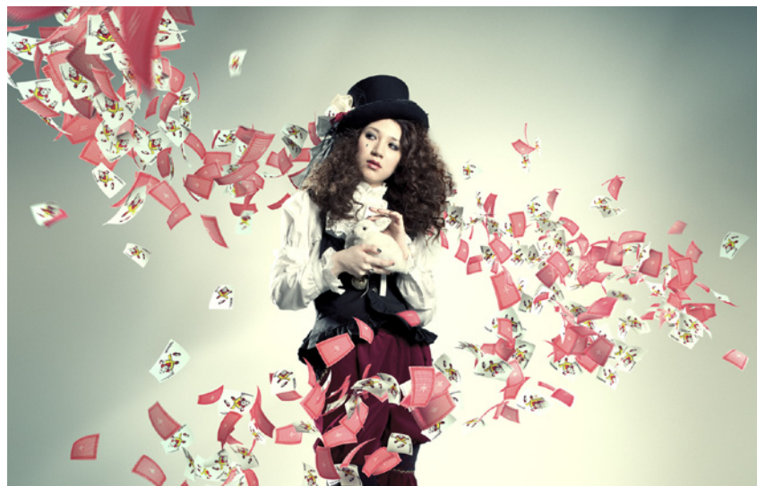
「コマースフォト誌」 人物は撮影、トランプは3DCGで制作