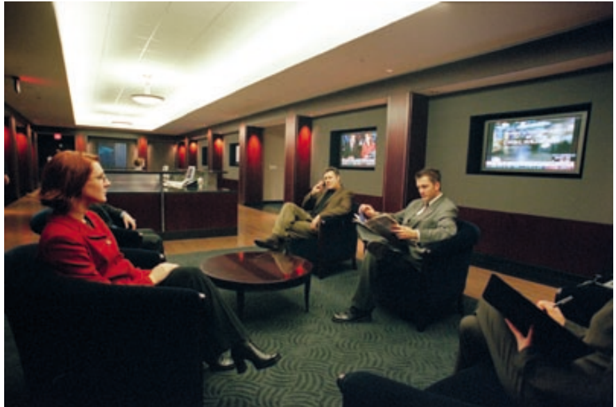
JP モルガン・フレミング・アセット・マネ - ジメントは特注設計されたレセプションエリアに、EIZOのカラープラスモニター FlexScan P5070を採用

また同社はEIZOの18.1型FlexScan液晶ディスプレイを全世界のトレーディングルームに採用した。搭載されている2系統入力機能によって1台のディスプレイに同時に2台のコンピューターが接続可能であり、信号切り換えはフロントパネルについている入力切り替えボタンを押すだけの簡単操作。したがって2台目のモニターを設置する必要がなく、特にトレーディングルームでは効果大である。「EIZO製品の他の機能同様、この2系統入力機能で効率が格段に上がった」とFleischer氏は話す。