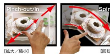
■マルチタッチ操作イメージ

Windows 7 のマルチタッチ対応アプリケーションでは拡大縮小（ピンチアウト／ピンチイン）、回転などの操作を2本の指を使って直感的に行うことができます。