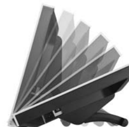
■スタンド可動イメージ

液晶モニターの背面部に、チルトの角度を10° ずつ6段階に調整できる専用スタンドを搭載しています。長時間の使用でも腕や目が疲れにくいモニター画面を見下ろすような角度や、無理なくペン入力やマルチタッチ操作が行える角度に調整が可能です。また、ぐらつかず安定しているため、しっかりとタッチ操作できます。