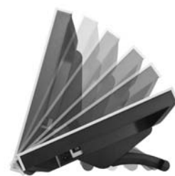
■スタンド可動イメージ

チルト角度をワンタッチで簡単に調整可能なスタンドを採用。タッチ操作を行う場合やオフィスワークを行う場合など、使い方に合わせて 10 度ずつ 6 段階に広範囲な調整ができ、快適な作業をサポートします。