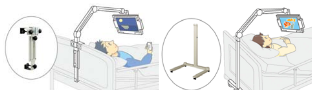
ベッドのヘッドボードに

ベッドのヘッドボードアタッチ型と移動可能なフロアスタンド型の取り付け金具をラインナップ。制約のある設置環境にも幅広く対応します。